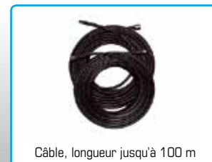
Câble, longueur jusqu'à 100 m